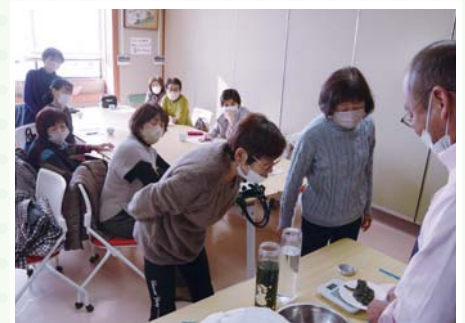
市販品とエコープマーク品を見比べる会員

参加した会員は「少し高くても、美味しく健康に良いエコープマーク品を選びたい」と話し、充実した研修会となった様子でした。