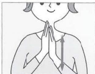
(1) 手のひら同士をこすります。時間があるときは手の甲側もこすりましょう。