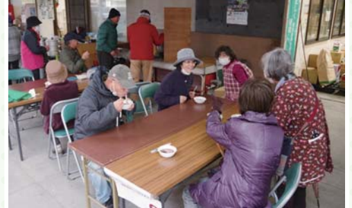
伸び～餅が入ったぜんざいを食べる買い物客

担当者は、「季節感を取り入れた朝市を企画し、直売所を中心に据えた交流の輪を広げていく」と意気込みを話しました。