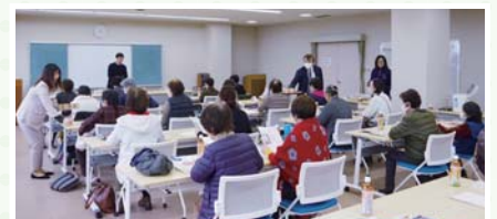
「こめ油」について理解を深める参加者

研修会に先立って調理されたおかきを試食した部員は、「時間が経っても鼻にツンとくる油臭さが無い。サラダ油からこちらに買い替えたい」と話し、充実した研修会となった様子でした。