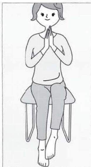
(3) (1)(2)を同時に行い、手足を共に温めます。