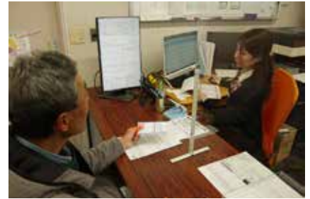
帳簿の内容を確認

担当者は「令和6年は、定額減税の実施に伴い、新たな事務処理が発生するため、慎重かつ丁寧な対応を心掛けていく」と話しました。