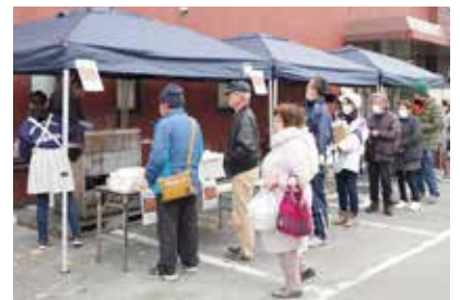
多くの人で賑わう朝市