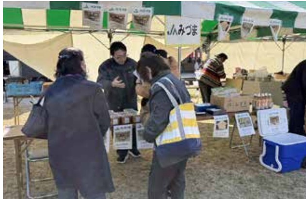
多くの来場者にJAみづまをPR

資材課は管内外のイベントに参加し、ハトムギ商品のPRを行っており、今後も販売拡大を目指していきます。