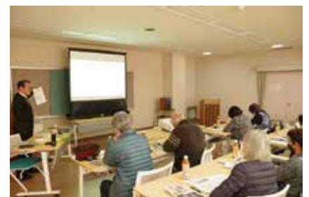
栽培のポイントについて熱心に耳を傾ける参加者

また、「家庭菜園を楽しむ女性部員の皆さまにも役立つ情報を提供し、栽培する楽しさを共有していきたい」と話しました。