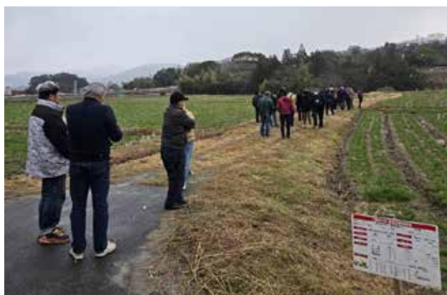
各圃場で視察を行う参加者