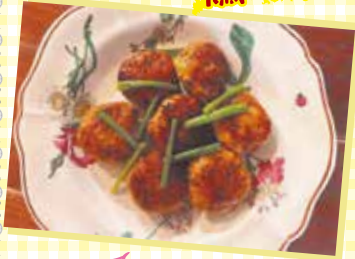
シャキシャキ食感が楽しい！ 冷めてもおいしいのでお弁当にも